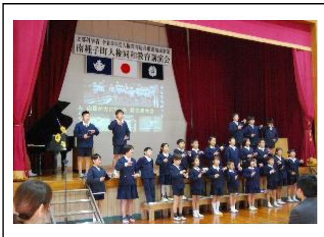
写真の名称：～みんなちがって、みんないい～ 「私と小鳥と鈴と」手話、合唱