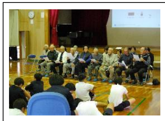
写真の名称： 地域の高齢者とのふれあい活動の様子