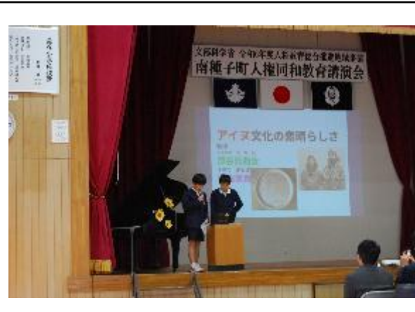
写真の名称：アイヌ文化の調べ学習発表