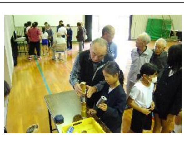
写真の名称： 地域の高齢者とのふれあい活動の様子