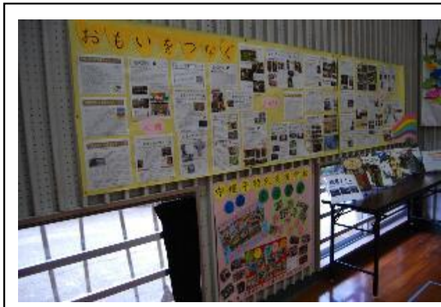
写真の名称：人権に関する展示コーナー

「人権教育研究推進事業（人権教育アーカイブの整備）」に係る「人権教育研究推進事業」資料素材