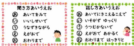
聞き方・話し方あいうえお