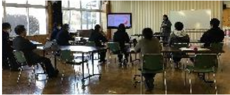
職員研修「外国人児童の現状と対応」