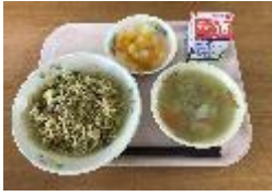
ワールドメニュー (フィリピン料理)