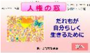
学習教材「人権の窓」