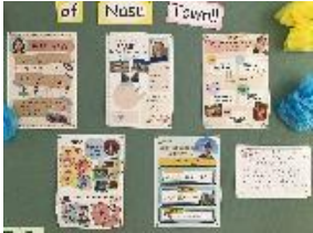
ALT作成の外国語コーナー